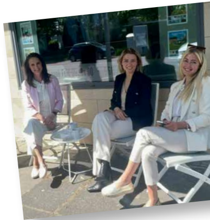
Unsere Coffeepause im Büro: Es gibt immer viel zu erzählen und zu lachen