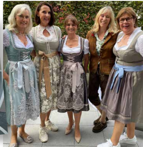
O'zapt ist!: Gemeinsamer Oktoberfest-Spaß mit Freunden