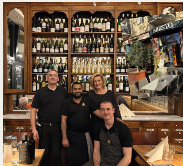
RESTAURANT EMPFEHLUNG ARESTO Bei Sabine ist es der Wohlfühcharakter, den sie an diesem Restaurant sehr

mag. Die Bedienung ist sehr nett und aufmerksam und besonders schön ist die Terrasse im Sommer direkt am Leineufer.